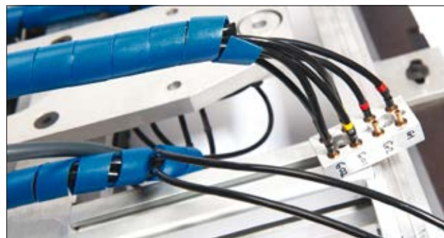
Detektierbare, metallhaltige Spiralschläuche schützen Kabel an Lebensmittelverarbeitungsmaschinen.