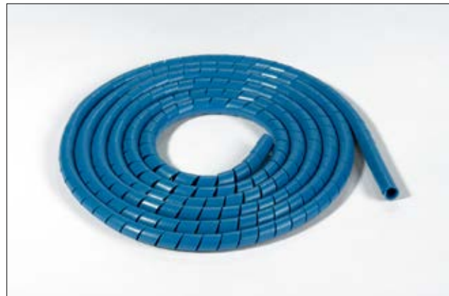
SBPEMC metallhaltige Spiralschläuche.