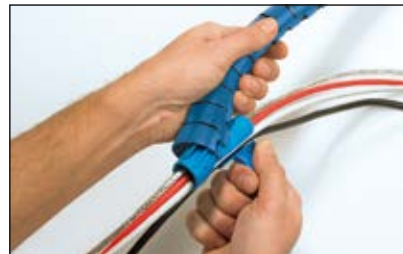
Helawrap auf das Werkzeug aufstecken.