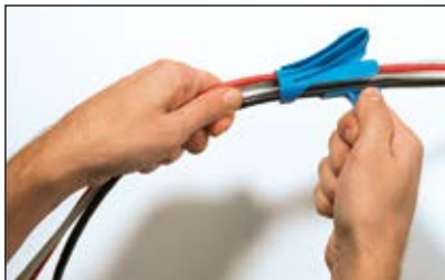
Kabelbündel seitlich in das Aufziehwerkzeug legen.