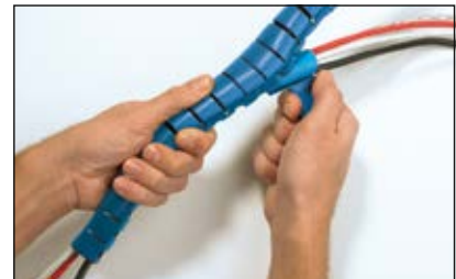
Helawrap wird nun nach dem Reißverschlussprinzip montiert.