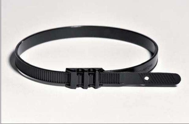
ROBUSTO Kabelbinder mit flacher Kopfgeometrie aus PA11.