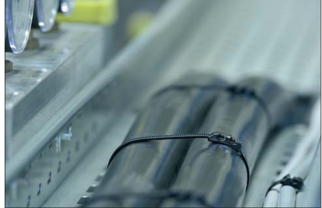
ROBUSTO Kabelbinder eignen sich für Kabeltrassen.