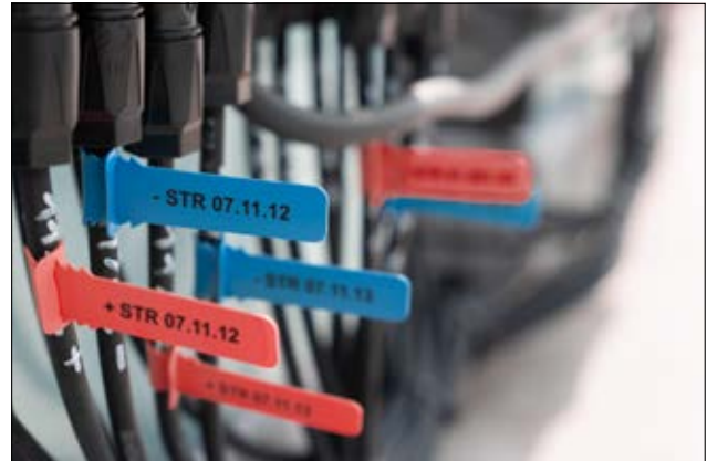
TAGPU LOOP – Ideale Lösung für die Kennzeichnung am Wechselrichter.