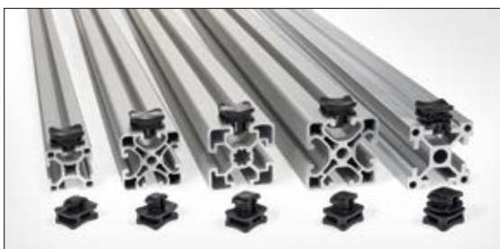
ACFM-Clip Familie mit einer Auswahl an Alu- Konstruktionsprofilen.